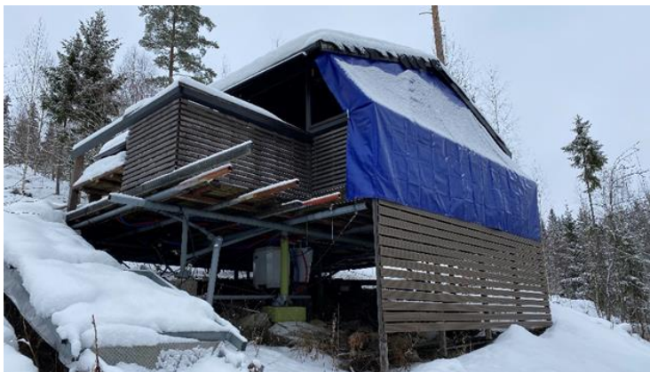
Saunarakennus kuvattuna rannan puolelta.

Suunnittelualueella on rakenteilla saunarakennus, jolla ei ole lain edellyttämää rakennuslupaa. Rakentaminen on ollut keskeytyksissä muutaman vuoden ajan.