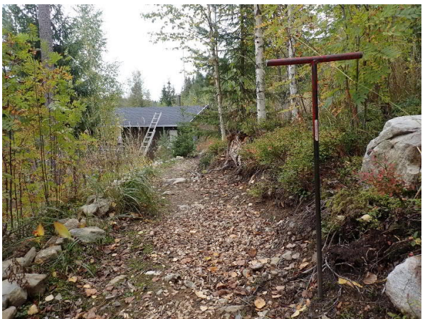
Saunarakennus ja pengerretty kulkureitti. Saunarakennukselta naapuritontille raivattu kulkureitti (oik.).

RA-alue on luontaisesti (ollut) jyrkkäpiirteistä, kivistä ja kallioista rinnemaastoa. Metsänhakkuiden jäljiltä se lienee ollut pusikoitunutta ja heinittynyttä hankalakulkuista maastoa, kuten se on lähiympäristössä. Sen perusteella arvioiden RA-alue ei ole ollut otollista arkeologisille muinaisjäännöksille eikä myöskään niiden havaitsemiselle. Siihen ei toisaalta ollut maastotarkastuksessa käytännössä mahdollisuuttakaan rakennustöiden edettyä noin pitkälle.