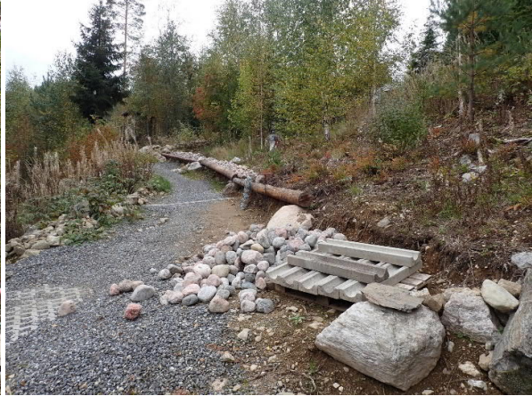
Loma-asunnon alakerta ja saunarakennukselta loma-asunnolle johtava pengerretty kulkureitti (oik.).