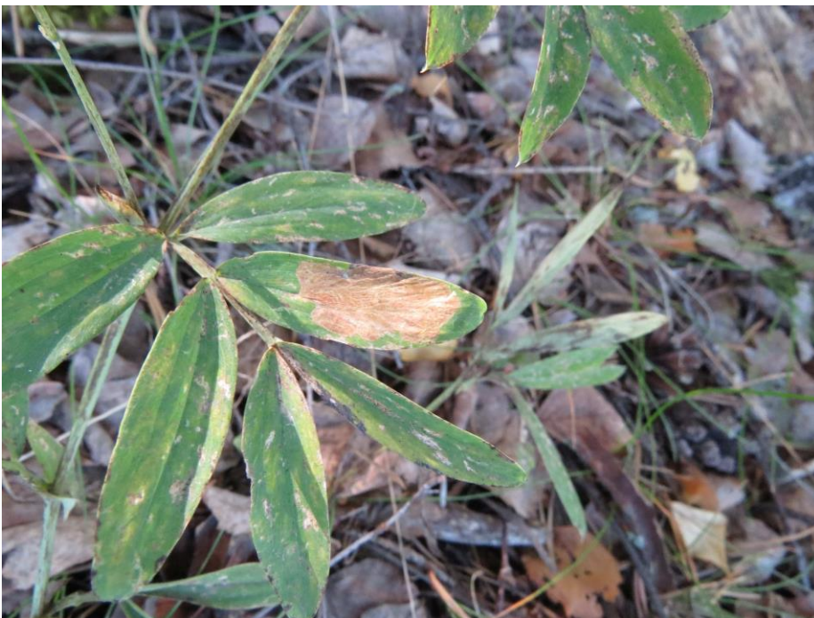
Kuva 1. Todennäköinen linnunhernetikkukoin tekemä miina