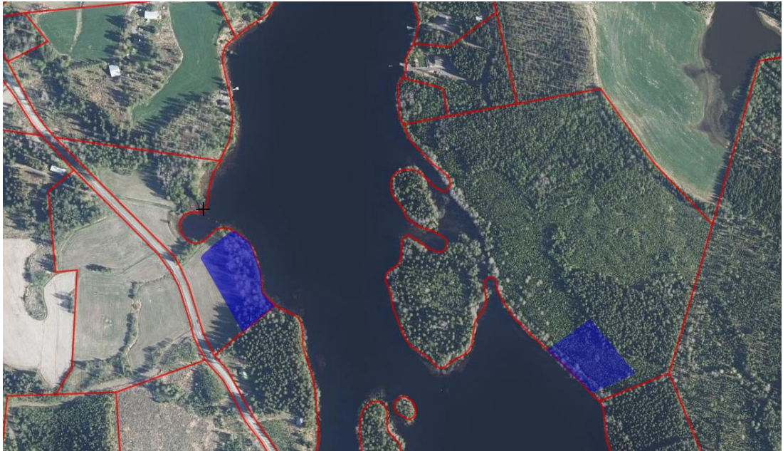
Simoskylän suunnittelualueen likimääräinen rajaus ilmakuvassa sinisellä (ilmakuva, MML).