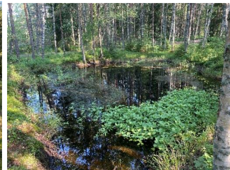
Nurmialuetta suunnittelualan keskiosassa. Oikealla kuvassa lampi/lähde suunnittelualan pohjoisosassa.