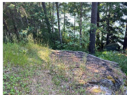
Kallioaluetta kiinteistöllä 322-528-1-97 MÄNTYKALLIO.