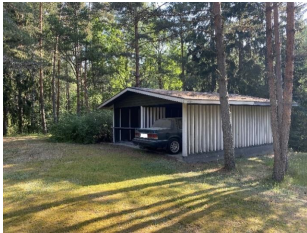
Autokatos suunnittelualan itäosassa.