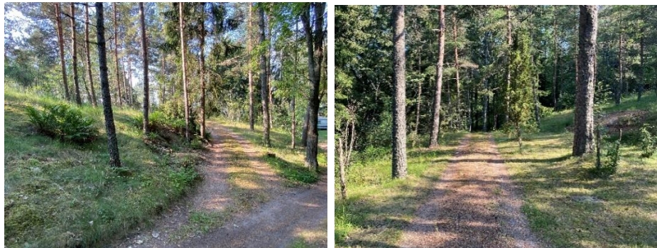
Suunnittelualueelle johtava ajoyhteys.

Suunnittelualan lähiympäristössä on sekä loma- että vakituista asutusta.