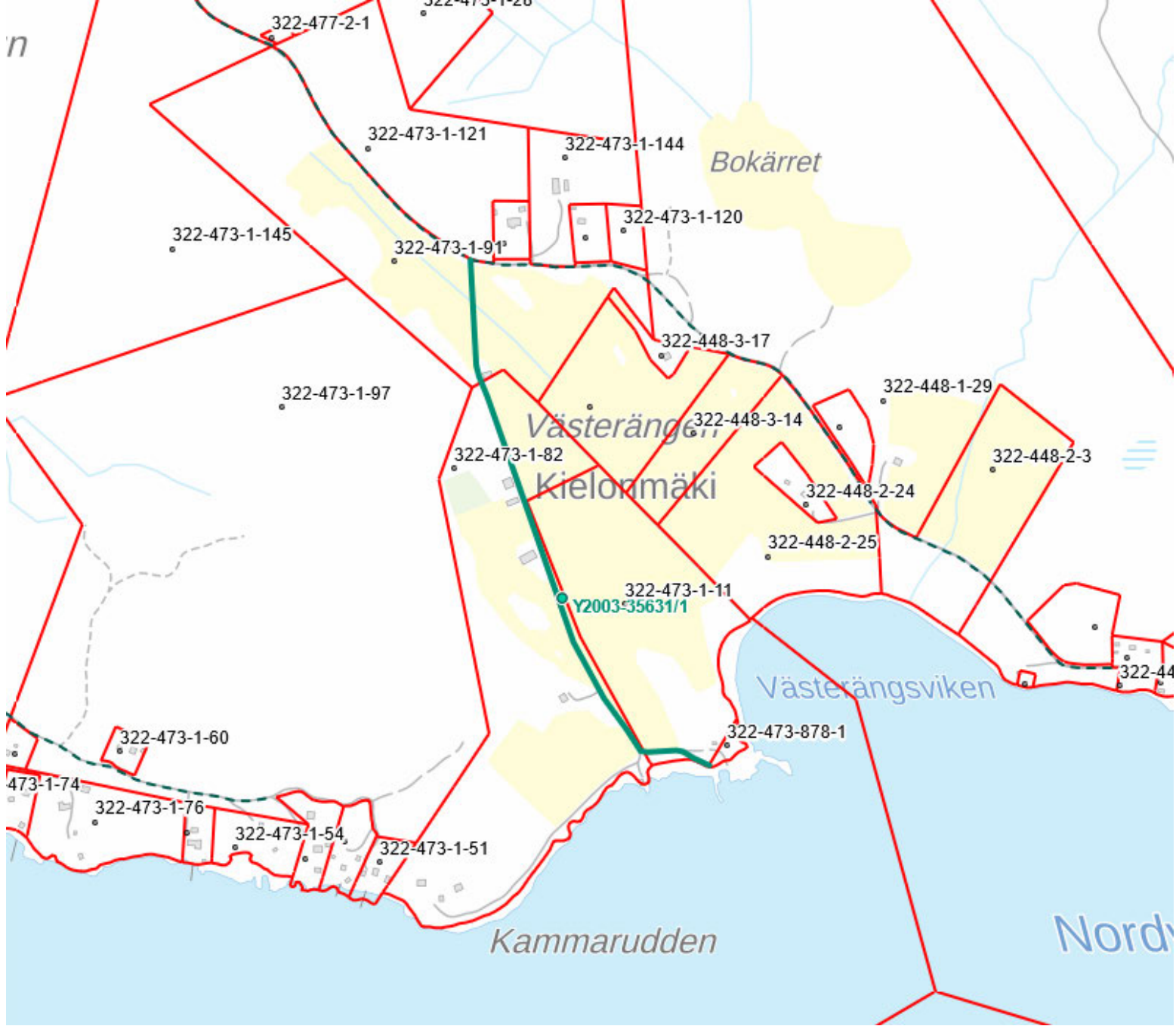
Tulostettu Maanmittauslaitoksen asiointipalvelusta