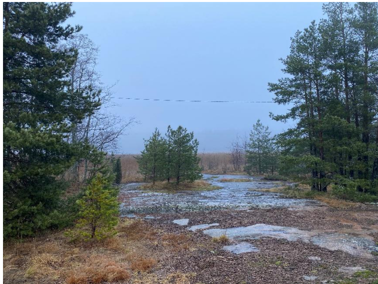
Suunnittelualan kalliosta lounaisrantaa.