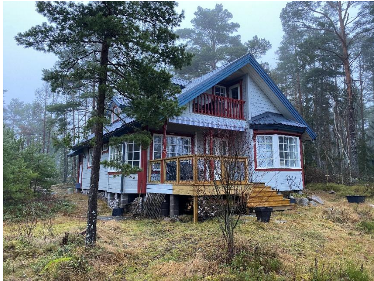
Loma-asuinrakennus korttelissa 11 kiinteistöllä 833-429-2-90 Laurinkari III.