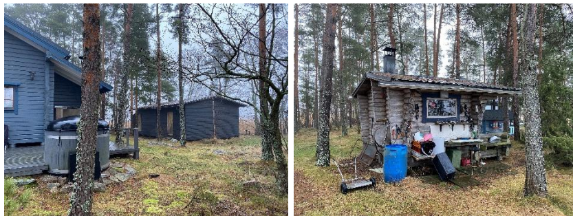
Kiinteistöllä 833-429-2-82-M604 YLI-JUNNILA olevat piha- ja saunarakennus.