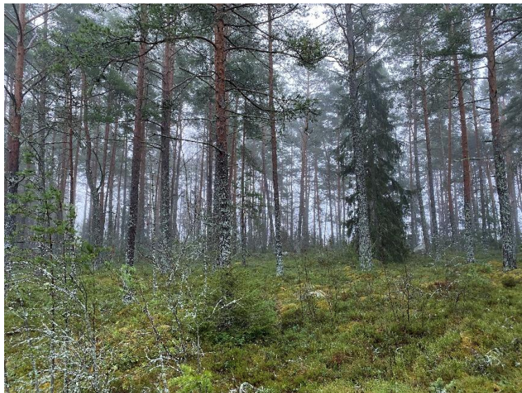
Suunnittelualan rakentamaton rakennuspaikka.