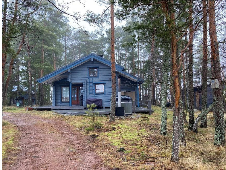
Loma-asuinrakennus korttelissa 11 kiinteistöllä 833-429-2-82-M604 YLI-JUNNILA.

Suunnittelualueella sijaitsee vapaa-ajan asuinrakennuksia sekä talousrakennuksia. Suunnittelualueen lähiympäristössä on loma-asumista.