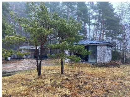
Kiinteistöllä 833-429-2-90 Laurinkari III olevat piha- ja saunarakennus.