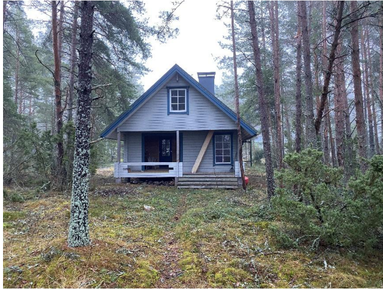
Loma-asuinrakennus korttelissa 11 kiinteistöllä 833-429-2-89 Laurinkari II.